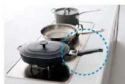
柄がカウンターから飛び出さず じゃまになりにくい。